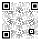
Bagi pengguna iPhone